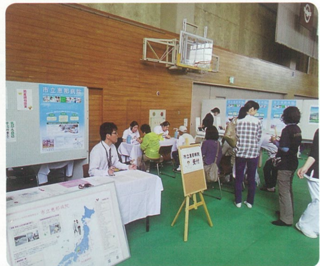
当院コーナーの状況