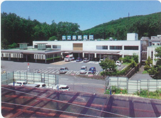
現在の市立恵那病院