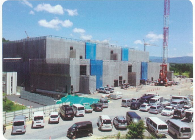
建設工事中新病院（H28.6.2 現在）