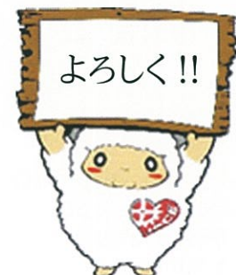
日本臨床工学技士会オリジナルマスコット