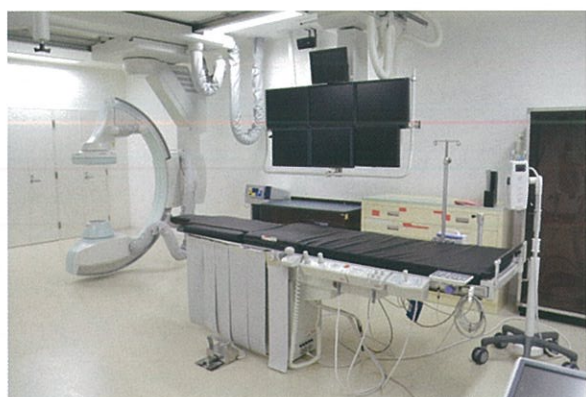
連続血管撮影装置

放射線室では健康管理センター内の装置も含めて、いわゆるレントゲン撮影を行う一般撮影装置3台、全身の横断面撮影や心臓血管の3D撮影などを行うCT撮影装置2台、強い磁気と電波を用いて全身の撮影を行うMRI撮影装置、体の中の血管の撮影や、腫瘍などの塞栓を行う連続血管撮影装置、胃透視や骨折の整復などを行うX線テレビ装置2台、腹部や頸動脈・心臓などの検査を行う超音波撮影装置2台、乳房のX線撮影を行う乳房撮影装置、骨粗鬆症の測定を行う骨密度測定装置、病棟でのX線撮影を行うポータブル撮影装置の計14台の装置を備えています。