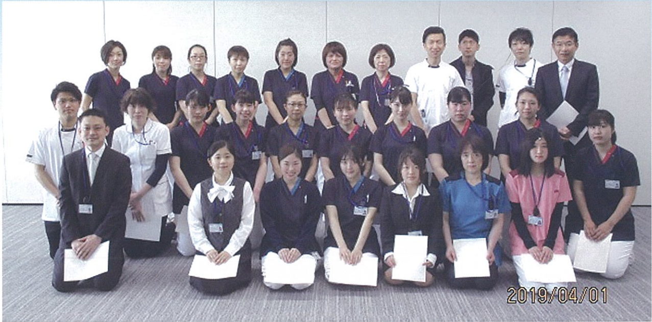
新規採用者と昇任者（辞令交付式）

今年度新規採用者、昇任者の辞令交付式がとりおこなわれました。 医師1名、看護師12名、ケアスタッフ1名、介護福祉士1名、理学療法士1名、臨床検査技師1名、事務職2名の19名が新たに恵那病院の仲間となりました。