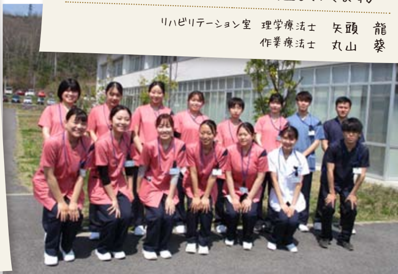
令和5年度 新入職員